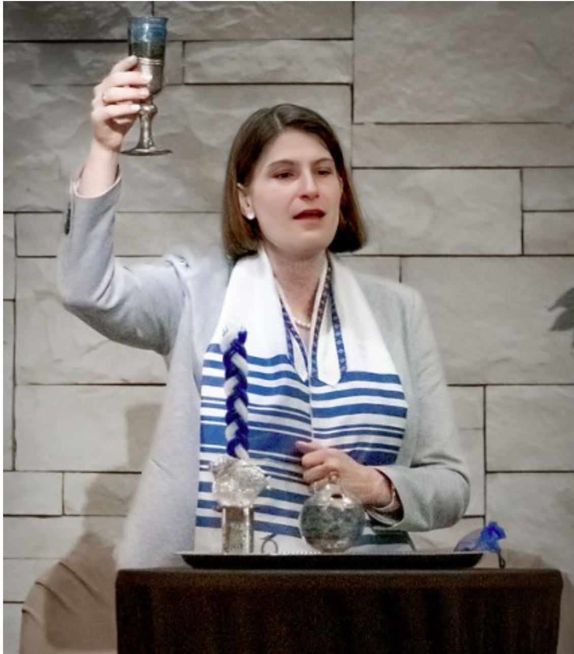
Congregation Or Ami Calabasas CA