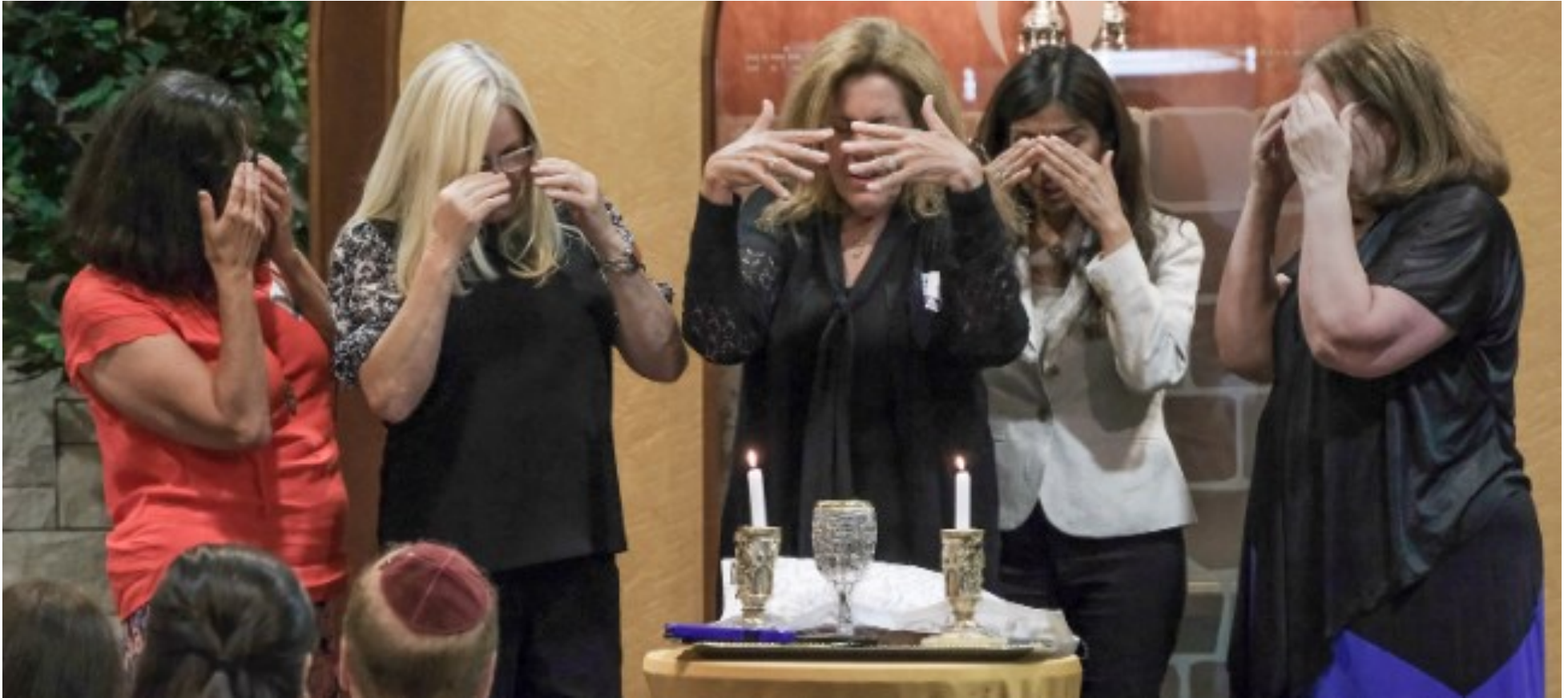
Congregation Or Ami Calabasas CA